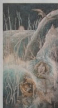
ZLATKO NEŽIĆ - "SVJETLOST ADAMJE"