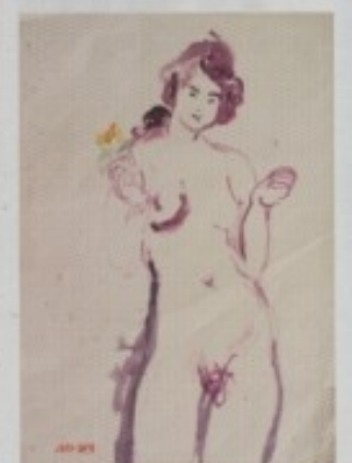
MIROSLAV USENIK - "DJEVOJKA S CVIJETOM"