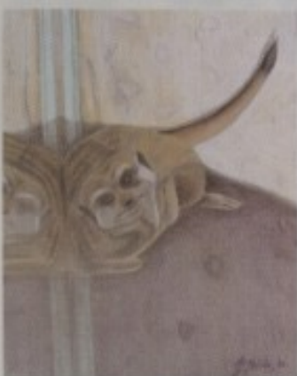
HANA - PETRA MRČELA - "MAJUN U LEŽEĆOJ POZI"