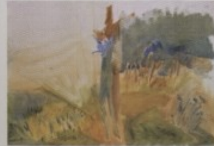
GORDANA JURČIĆ - "RASPELO"