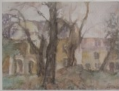
JADRANKA FATUR - "DVORAC"