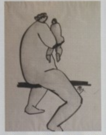
VINKO FABRIS - "MAJKA I DIJETE"