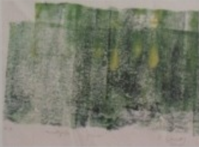
PETRA GROZAJ - "JEZERO"