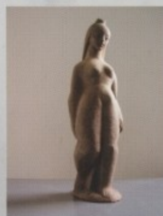
ZLATKO POTOČKI - "DJEVOJKA"