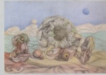
ZORAN GALIĆ - "BLJESAK"