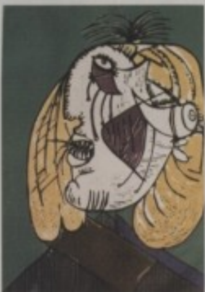
IGOR KONJUŠAK - "PLAČ MAJKE"