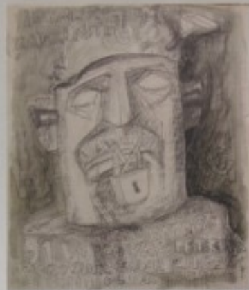
BRANKO KELČEC - "HRVATSKI VOJNIK"