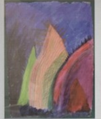
MIRNA KREŠIĆ - "SAN I"