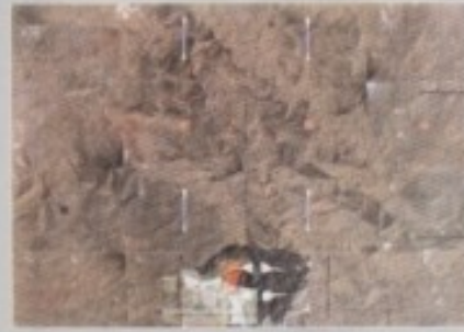
VINKO FIŠTER - "ZEMLJOPIS X"