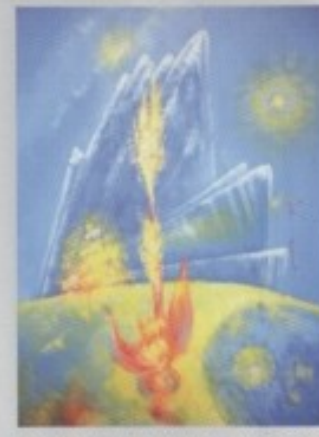
TOMISLAV DILBER - "VISOKO"