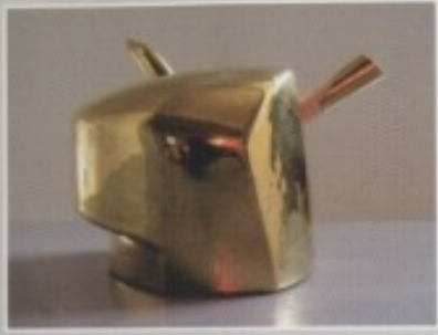
ROBERT BAČA - GLAVA 39