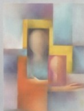
VLADIMIR POLIĆ - "MADONA I DIJETE"