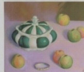
BRANKO MANOJLOVIĆ - "MRTVA PRIRODA"