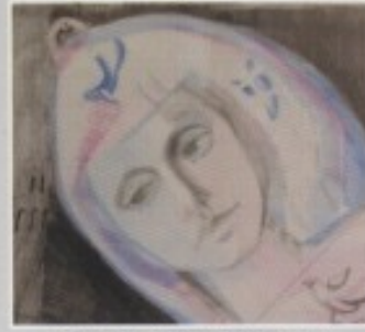
VERA DAJHT - KRALJ "DJEVOJKA S GOLUBOM"