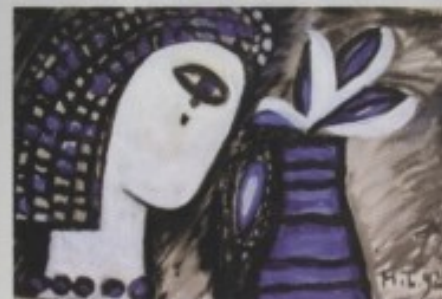
MILENA LAH - "DUBROVKINJA III"