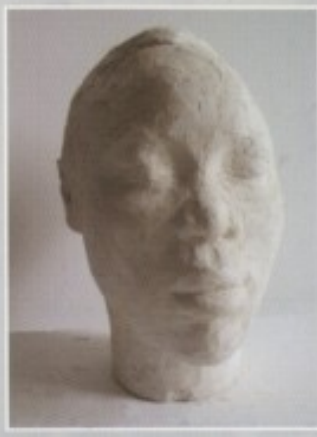
NELKA ČULAR - "CRNKINJA"