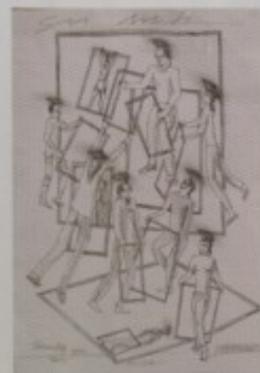
VLADIMIR GUDAC - "SVI SVETI"