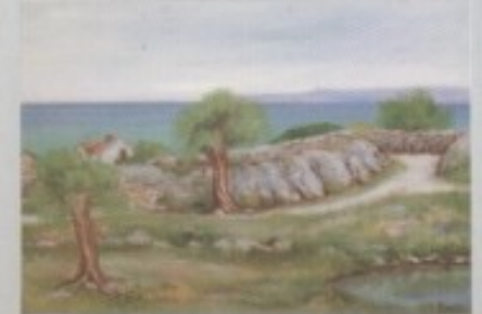
VESNA KAJIĆ - LALIĆ - "MASLENIK"