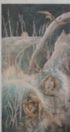
ZLATKO NEŽIĆ - "SVJETLOST ADAM'E"