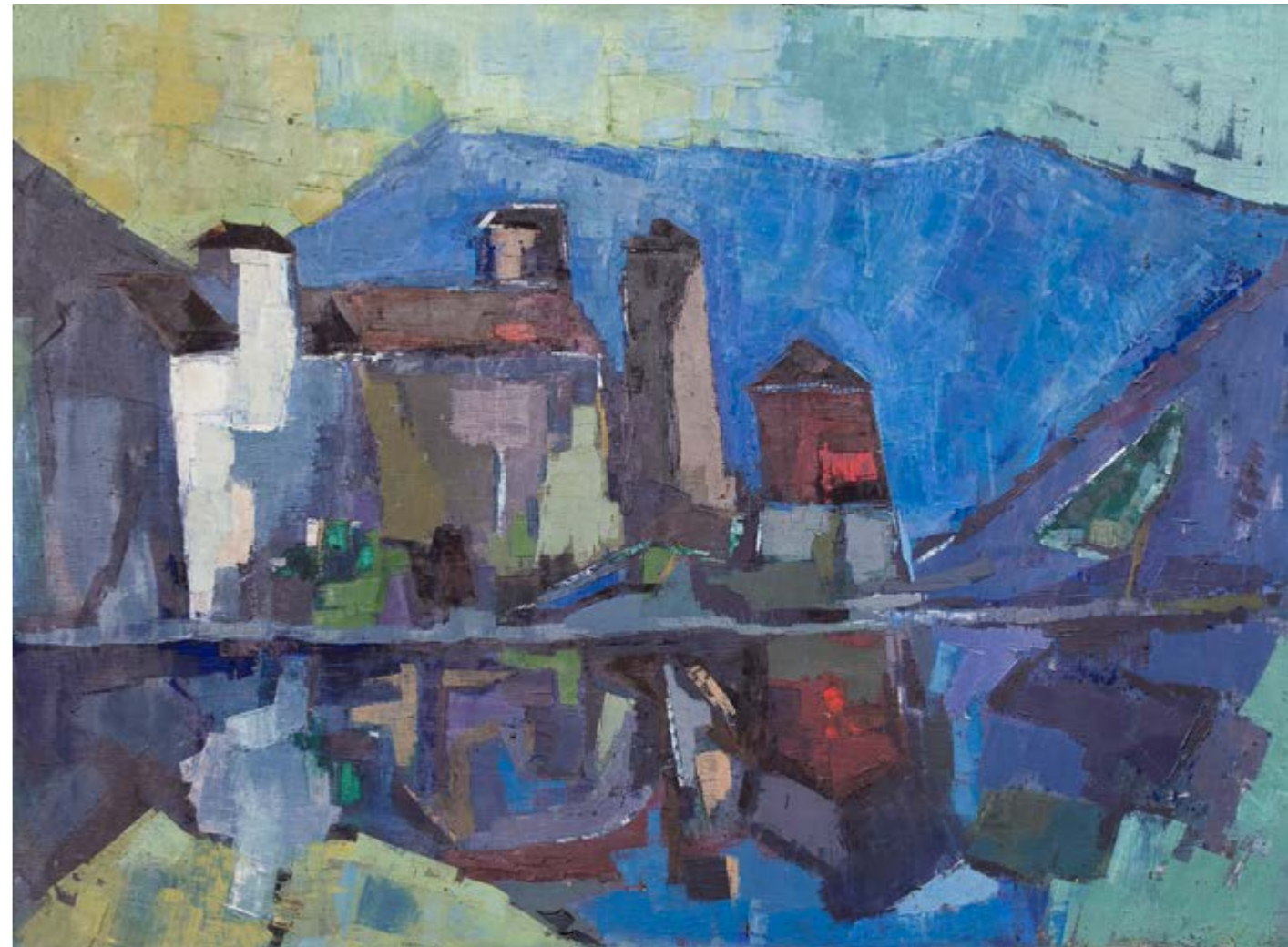
Antun Šojat , Iz Boke, 1971./72., ulje na platnu, GMB-5981