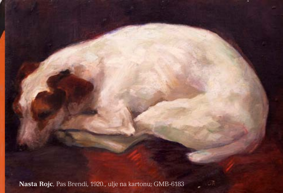
Nasta Rojc, Pas Brendi, 1920., ulje na kartonu, GMB-6183