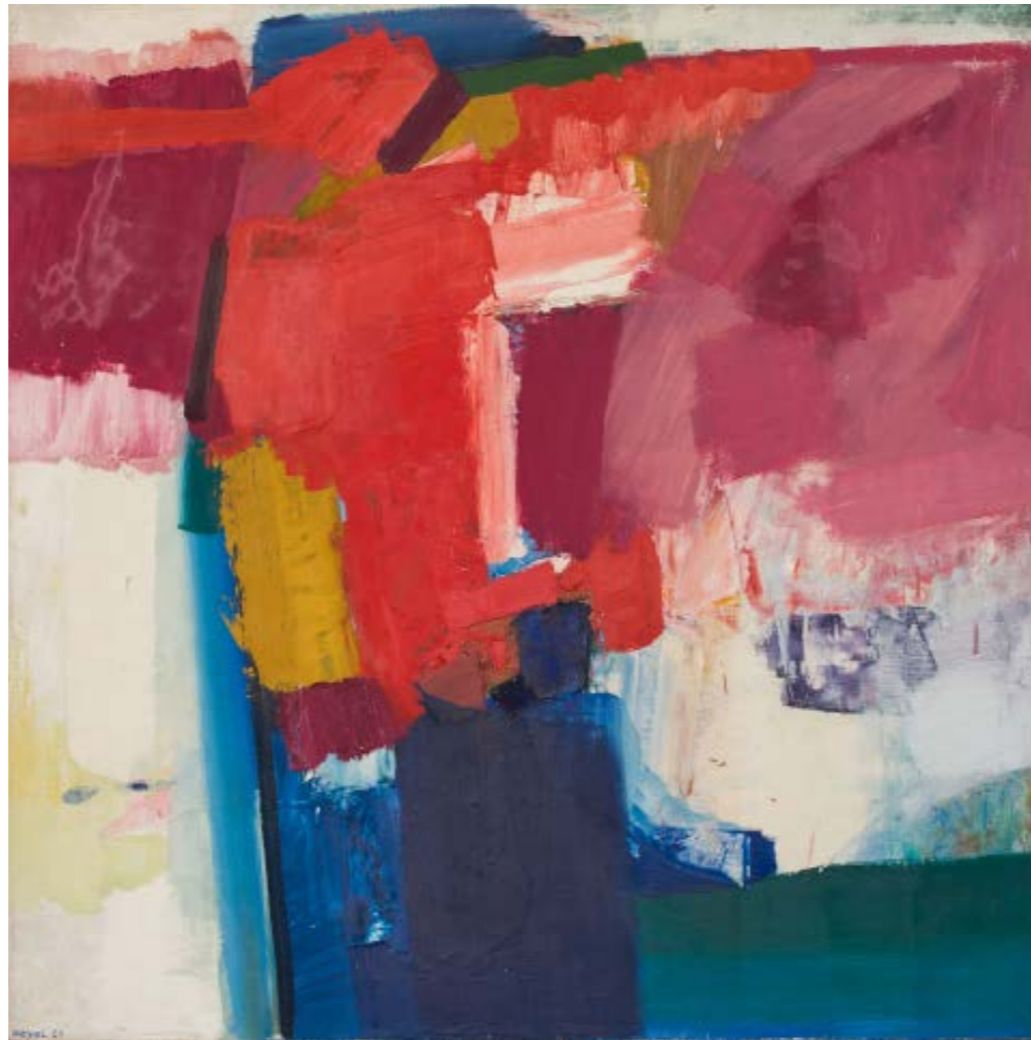
Nikola Koydl , Izvor svjetlosti, 1965., ulje i tempera na platnu, GMB-5955