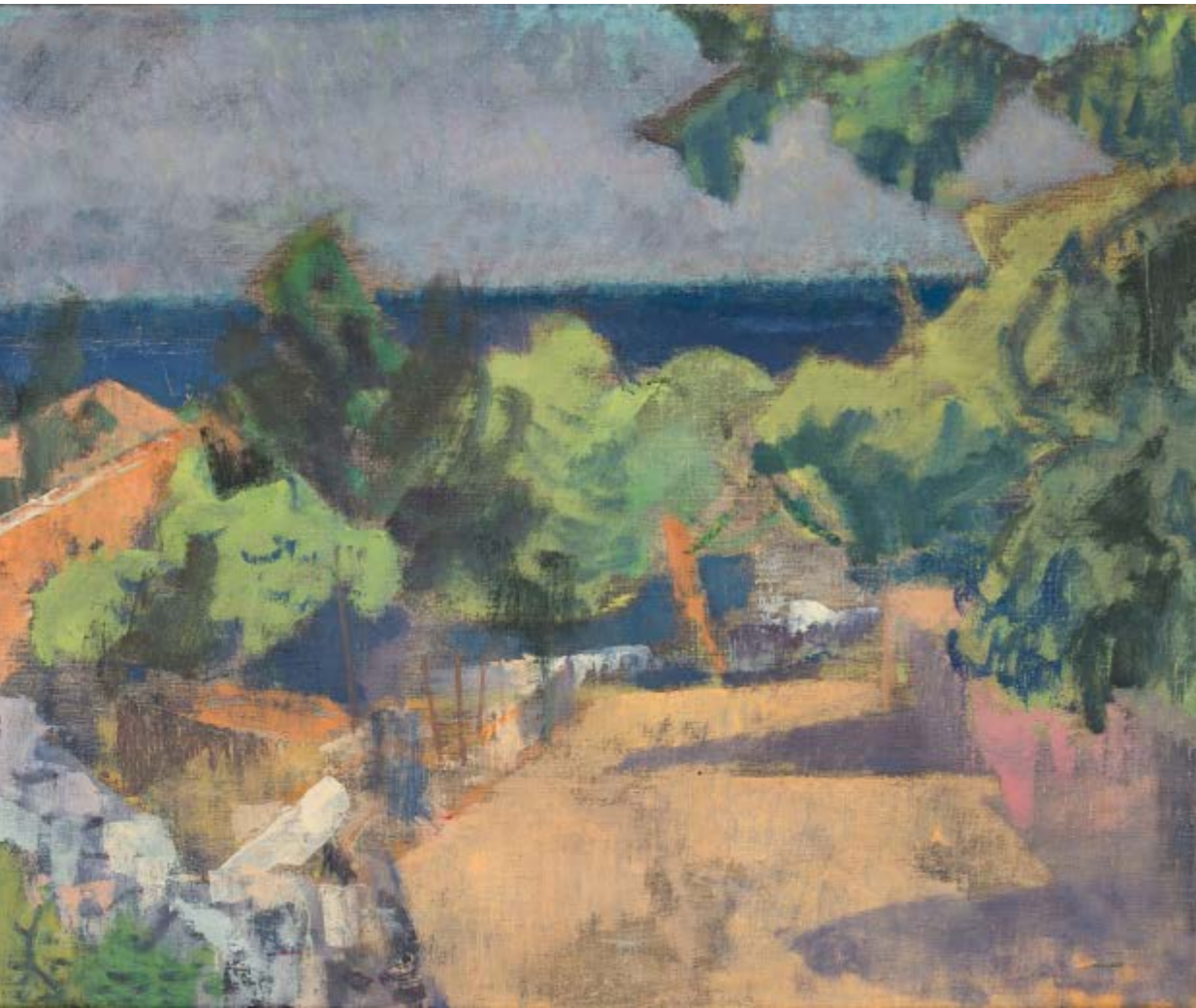
Zlatko Šulentić , Primorski pejzaž, ulje na lesonitu, GMB-5969